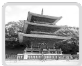
五流尊徳院 三重塔 熊野神社・五流尊徳院 (国県指定重要文化財)