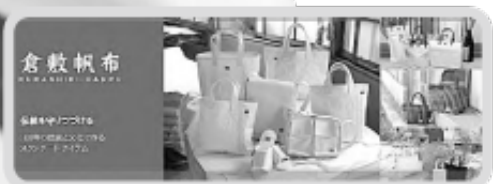
倉敷帆布 KURANO FURO